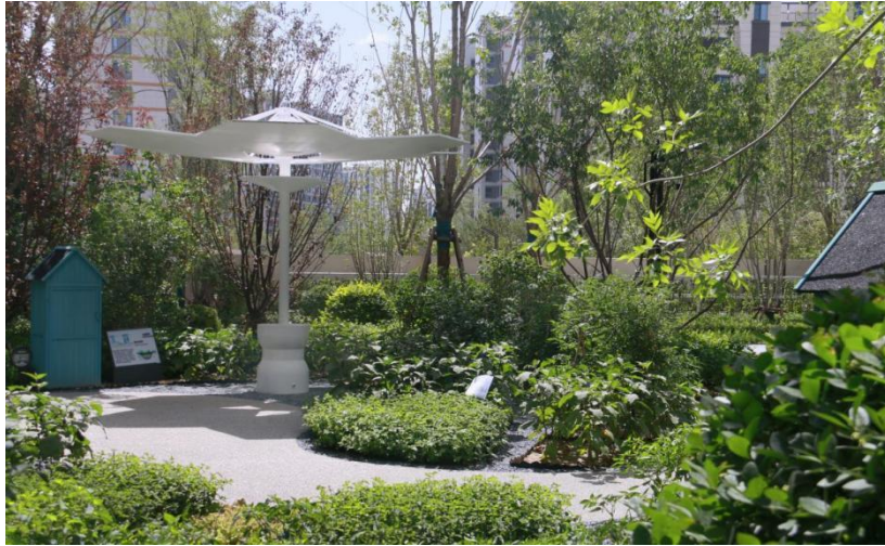
△雨水收集器，收集的雨水还可以用来浇花、浇菜